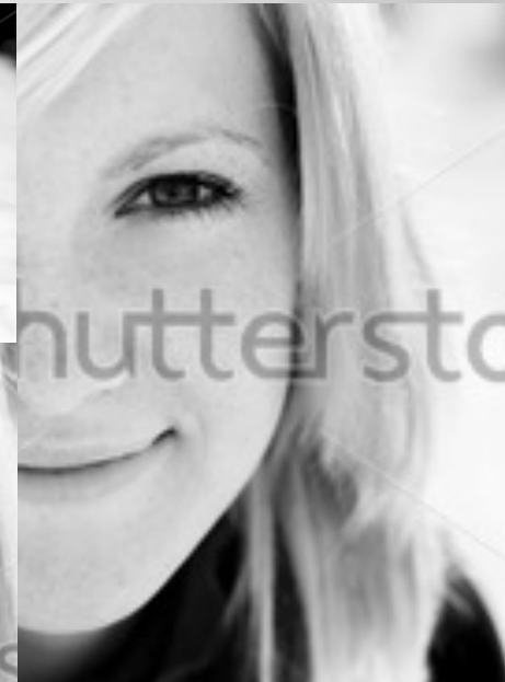
Immagine ad esempio: