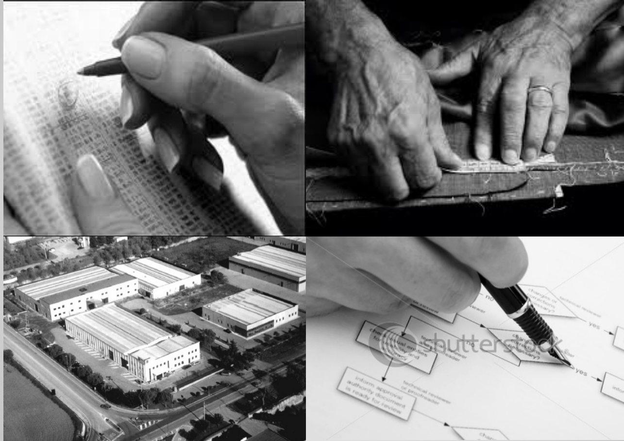
Immagine ad esempio:

Immagini che richiamano un universo estremamente specializzato, attento al dettaglio con contenuto tecnico. Contrasto analisi quantitativa/produzione industriale ed artigianalità