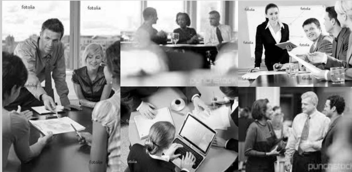
Immagine ad esempio:

Immagini del gruppo, varie angolazione, particolari dell'ufficio, oggetti sfumati in primo piano, etc. (scatti multipli, utilizzabili anche in altre parti del sito o della presentazione)