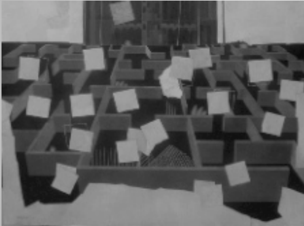
Immagine ad esempio: Tema del labirinto/ricerca, la più adatta è quella orizzontale del labirinto con piramide