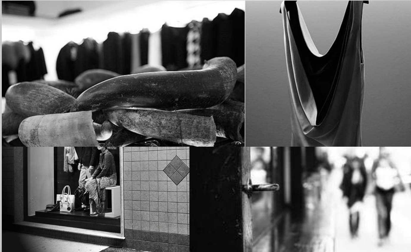
Immagine ad esempio:

Immagini che richiamano il mondo dei negozi e della distribuzione selettiva: il layout di riferimento e la vetrina con passanti sfuocati condivisa in fase di brief